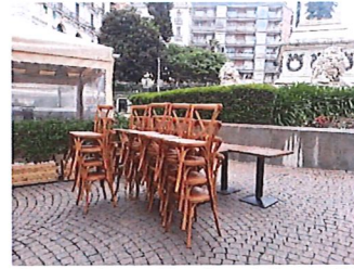
Ingombri disordinati con suppellettili varie (la prima foto denuncia chiaramente l'ostruzione alla vista del portale)