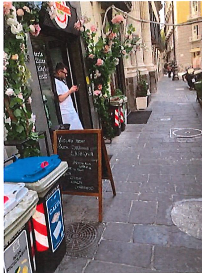
Ingombri tutti appoggiati alla facciata