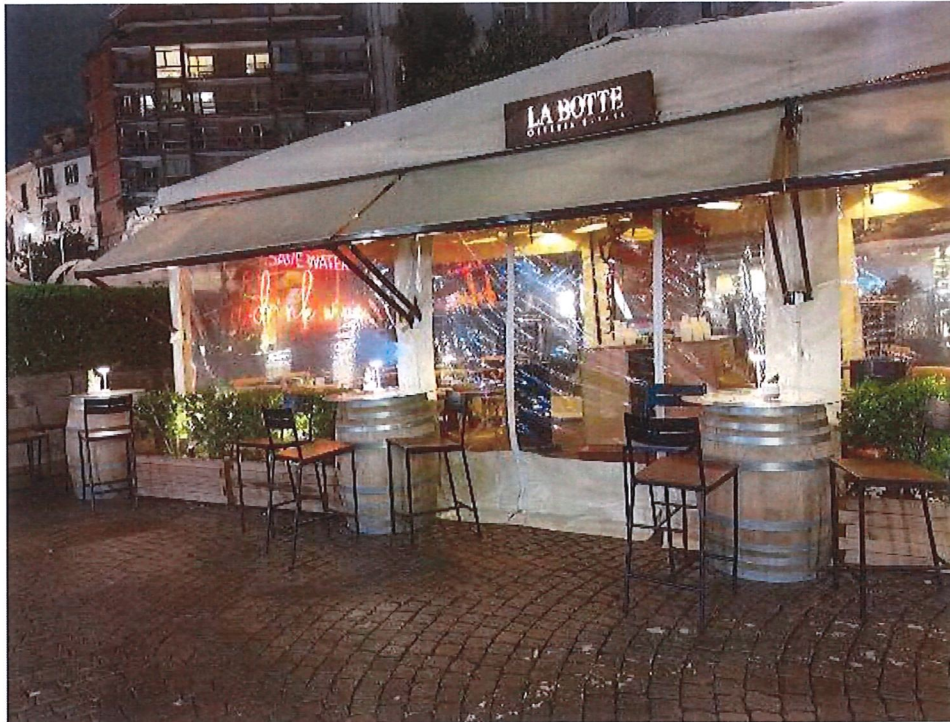
Vista laterale del gazebo con la presenza della tenda certamente al di fuori del perimetro autorizzato e con estensione della superficie occupata con i "sedili-botte"