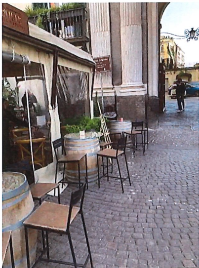
Evidente occlusione della vista del portale